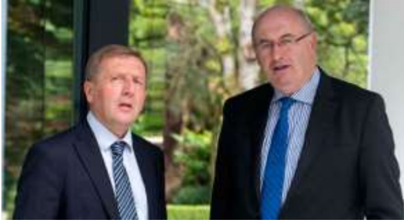
Europski povjerenik za poljoprivredu i ruralni razvoj Phil Hogan i irski ministar poljoprivrede M. Creed na konferenciji Cork 2.0

Sudionici konferencije Cork 2.0, zaključili su u Deklaraciji da se inovativna, integrirana i uključiva ruralna i poljoprivredna politika u Europskoj uniji treba temeljiti na sljedećih deset smjernica: