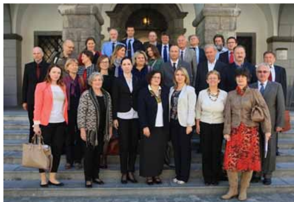
Osnivanje mreže CiViNET, Ljubljana

Zajedno s Gradom Koprivnica s hrvatske strane te s Gradom Ljubljanom i REC-om Slovenija pokrenuli smo osnivanje Hrvatsko-Slovenske mreže CIVINET, koja je osnovana 25. travnja 2013. u Ljubljani i kojoj se već prilikom osnivanja potpisivanjem memoranduma priključio veći broj gradova (pored Koprivnice i Zagreba, Rijeka, Dubrovnik, Samobor, Čazma, Ivanić Grad, Zaprešić i dr.) te drugih relevantnih dionika (npr. ZET). Cilj mreže je prijenos znanja i dobre prakse te osmišljavanje zajedničkih projekata kojima će se financirati buduće aktivnosti prometne održivosti u gradovima.