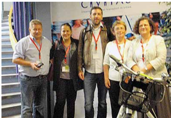
Hrvatski predstavnici na CIVITAS FORUM-u, Brest

Forum je bila prilika za susret mreža CIVINET, uključujući i novu mrežu koju su u travnju 2013. godine uspostavili hrvatski i slovenski gradovi i drugi zainteresirani dionici. Predstavnici CIVINET Slovenija-Hrvatska iz Zagreba, Koprivnice i Ljubljane razgovarali su o planiranim aktivnostima u započetom projektu CIVITAS CAPITAL iz kojeg će se financirati neke aktivnosti Mreže. Više o Forumu na http://www.civitas.eu/content/civitas-forum-conference-2013