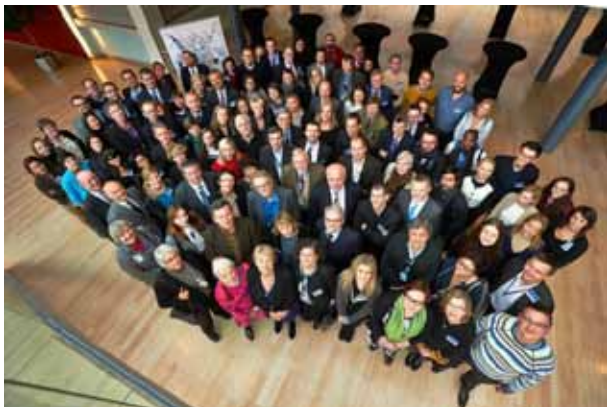
Zajednička slika sudionika konferencije

EGSO je seminar organizirao u suradnji s Europskim parlamentom i uz potporu EurActiv. Izvještaj sa seminara može se pročitati na sljedećem linku: http://bit.ly/1bxZouB .