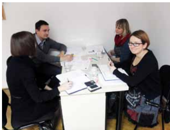
Prvi sastanak projektnog tima, Hrvatski zavod za zapošljavanje