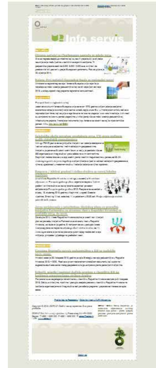
E-bilten MLR Info servis