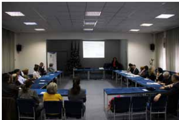
Okrugli stol o okolišnoj dozvoli, Tribine grada Zagreba