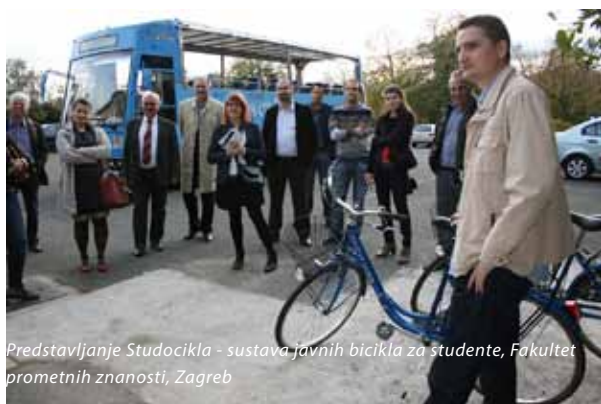
Predstavljanje Studocikla - sustava javnih bicikla za studente, Fakultet prometnih znanosti, Zagreb

Više o ovome događanju može se pogledati ovdje: http://bit.ly/L9xfh2 .