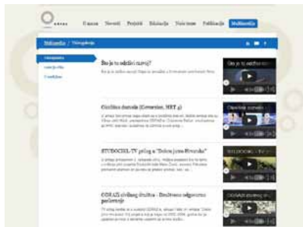
Mrežna stranica odraz.hr

Od 1. siječnja do 31. prosinca 2012. stranicu je posjetilo ukupno 2.361 pojedinačnih posjetitelja (unique visitors), od kojih 76,8% novih posjetitelja te 23,2% stalnih posjetitelja. Zabilježeno je 2.992 posjeta, a stranice su pregledane ukupno 9.014 puta (izvor: Google Analytics).