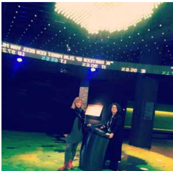
Posjet Parlamentarium-u, Bruxelles