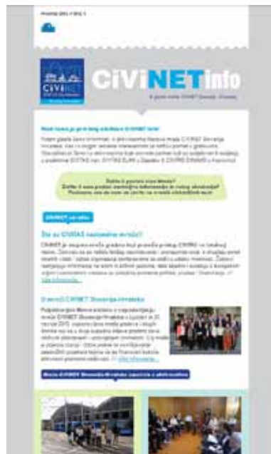
Prvi broj -bilten CIVINET Info