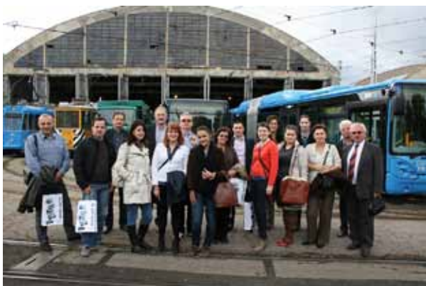
Studijski posjet u Zagrebu, Terminal ZET