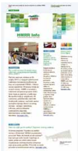
E-bilten HMRR Info

ODRAZ je jedan od osnivača HMRR-a i zadnjih nekoliko godina pruža aktivnu podršku djelovanju te Mreže. Ksenija Vidović Vorberger iz ODRAZ-a pružila je stalnu podršku pri administriranju i uređivanju web stranice i e-glasila HMRR Info . U travnju je unaprijedila e-bilten HMRR Info u Mail Chimp sustavu (besplatan servis za kreiranje e-glasila).