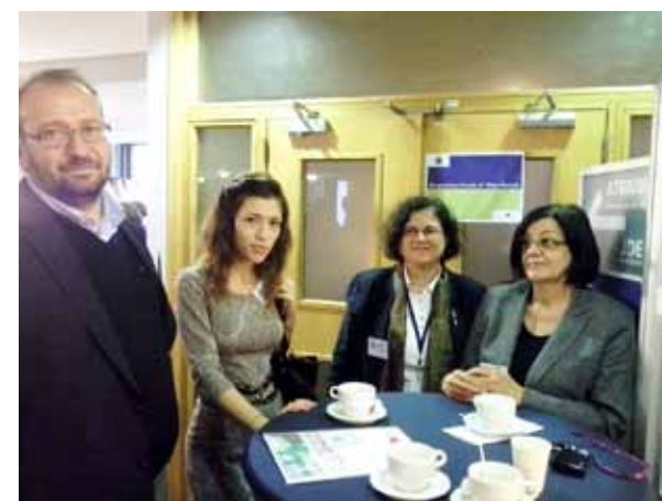
Neformalno druženje za vrijeme pauze, Prvi Europski ruralni parlament, Bruxelles

Sveinformacije o ERP-u, koji će se redovno organizirati i sljedećih godina, možete pratiti na http://europeanruralparliament.com . Na toj stranici je i izjava koju su usvojili sudionici, koja govori o viziji ruralne Europe i njenom ostvarivanju kroz partnerstvo.