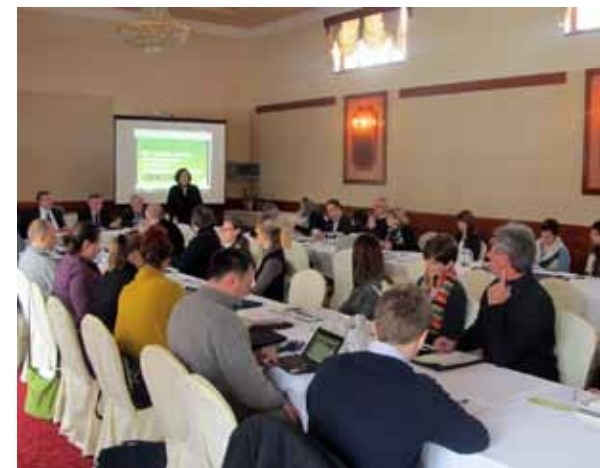
Otvaranje konferencije, Ludbreg

Prezentacije s konferencije mogu se pogledati na sljedećem linku: http://bit.ly/1kJeArE