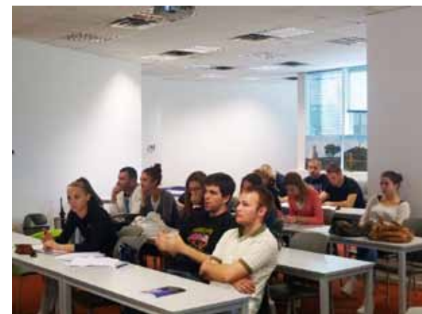
Veleučilište VERN, Zagreb