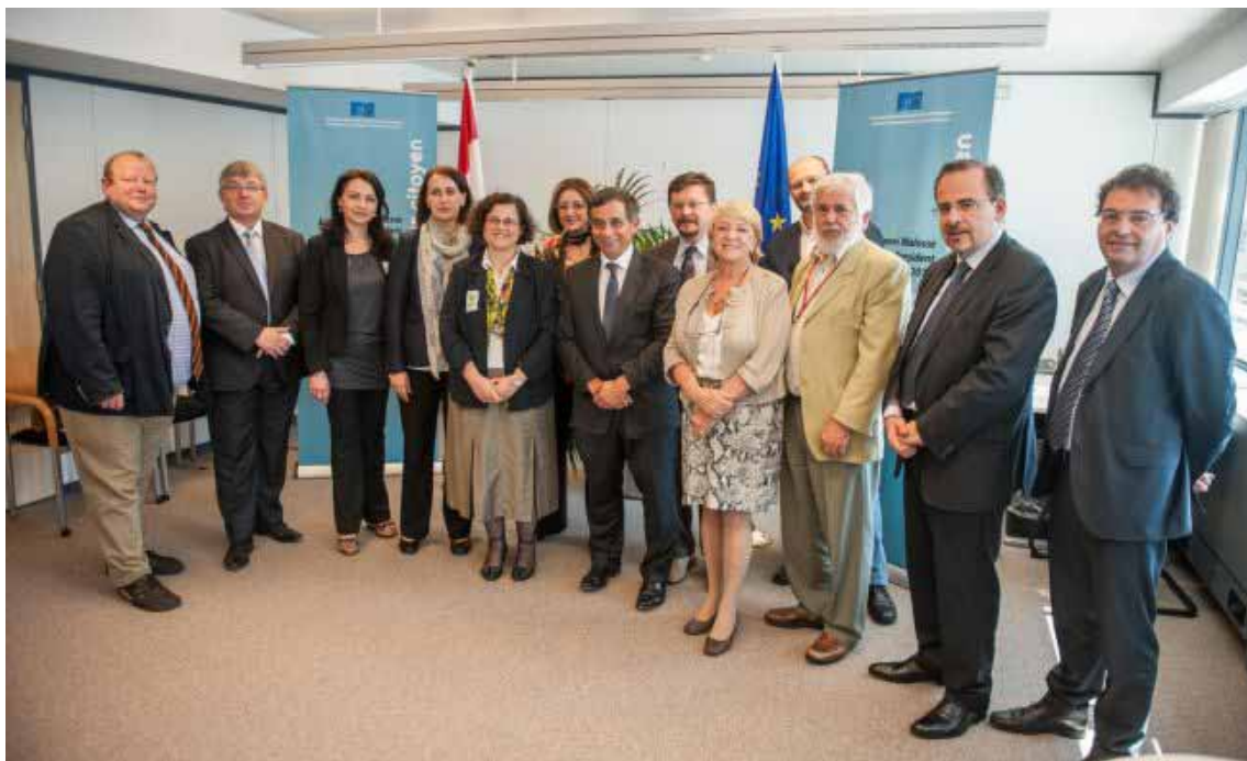
Imenovanje devet hrvatskih članova u Europskom i gospodarskom socijalnom odboru (EGSO), Bruxelles

Više o aktivnostima u okviru EGSO-a i izvještaji mogu se pogledati na sljedećem linku: http://www.odraz.hr/hr/novosti/egso-europski-gospodarski-i-socijalni-odbor .