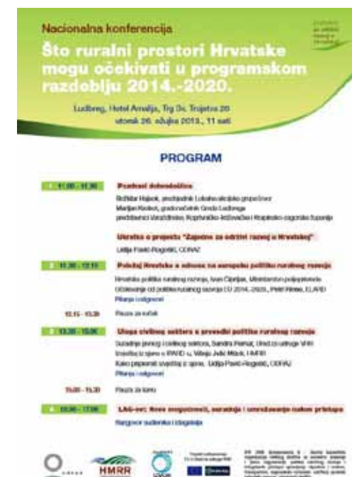
Plakat za nacionalnu konferenciju

Paralelno se radilo na analizi IPARD-a temeljem razgovora s relevantnim stručnjacima, proučavanjem dostupne dokumentacije, usporedbom dokumenata EU i dr. Temeljem svih tih nalaza pripremljen je izvještaj iz sjene “IPARD – jučer / danas / sutra” koji je dostavljen i široj dioničkoj skupini na komentare putem društvene mreže Yammer “Ruralni razvoj u Hrvatskoj” , koja okuplja 40-ak dionika iz cijele Hrvatske te iz inozemstva, a koji su bili uključeni u proces izrade izvještaja. Elektronska verzija priručnika može se preuzeti na sljedećem linku: http://odraz.hr/media/151151/ipard_jds_web.pdf