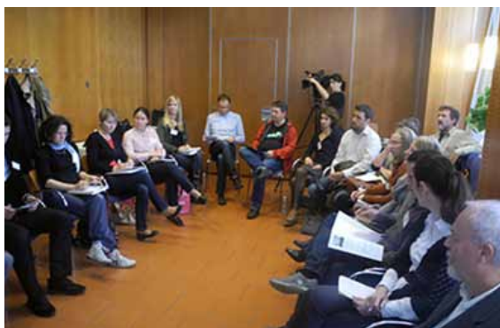
Sastanak CIVINET-a, Ljubljana