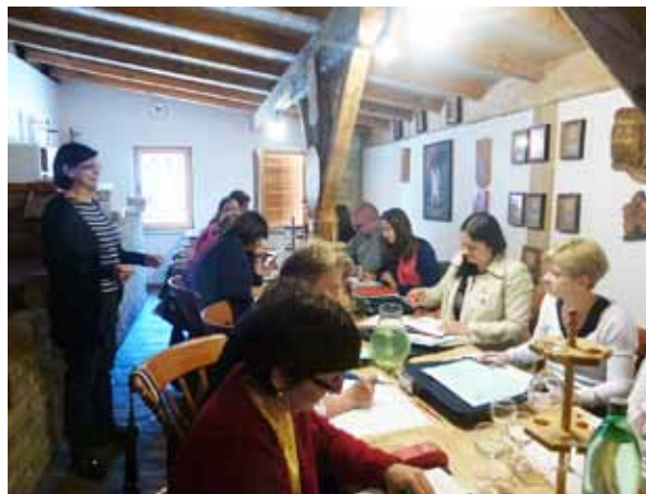
Trodnevni trening kao podrška radu LAG-a Baranja, Karanac

Ciljevi treninga bili su: upoznati sudionike s osnovnim principima mobiliziranja i organiziranja zajednice; osvijetliti uloge sektora u društvu i komplementarnost njihovih doprinosa razvoju zajednice; upoznati sudionike s razinama uključivanja dionika u promišljanje razvoja zajednice; raspraviti potrebe, mogućnosti i ograničenja uspješnom razvojnom partnerstvu; upoznati sudionike s načelima i značajkama europskog pristupa LEADER ruralnom razvoju; doprinijeti jačanju vještina i sposobnosti mladih dionika na području planiranja razvoja zajednica i upoznati sudionike s osnovnim elementima i koracima planiranja lokalnog razvoja, prateći Strategiju područja LAG-a Baranja.