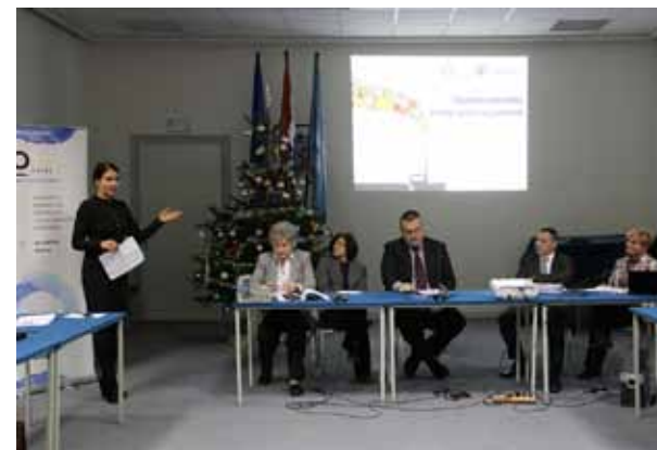
Okrugli stol "Sudjelovanje javnosti u postupku ishođenja okolišne dozvole", Tribine grada Zagreba