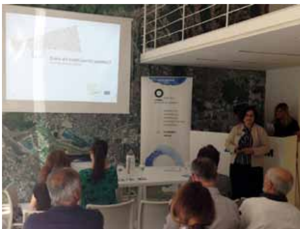
Predstavljanje publikacije “Kako do boljih javnih politika?”, ZgForum

Također je prikazala i neke od nalaza analize provedbe IPARD-a, a svi posjetitelji su dobili i primjerak publikacije.