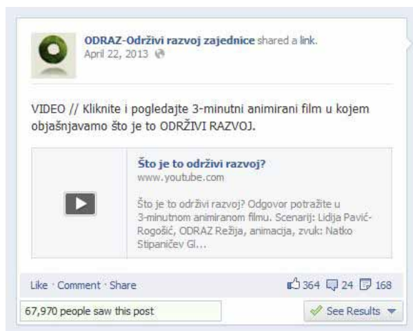
Promocija animiranog filma "Što je to održivi razvoj?" na Facebooku

Facebook smo iskoristili i za promociju animiranog filma "Što je to održivi razvoj?" kojeg je do sada vidjelo 67.970 ljudi, dok je na ODRAZ-ovom You Tube kanalu zabilježeno 5.453 pogleda.