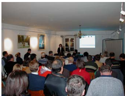
SKUP U JELSI; studeni 2002.

Za svaku temu iskazan je interes prisutnih koji su nakon predavanja postavljali pitanja i nastavljali razgovore i nakon formalnog dijela.