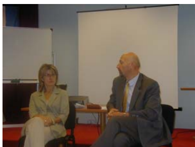
CRIKVENICA, rujan 2003. Gost Programa - gradonačelnik Crikvenice Ivica Malatestinić

Organizator zajednice pomaže u identificiranju njenih problema, određivanju prioriteta i pronalasku rješenja kako da se problemi zajednički rješe. Organizator zajednice potiče civilne inicijative i odgovornost lokalne zajednice za njen razvoj.