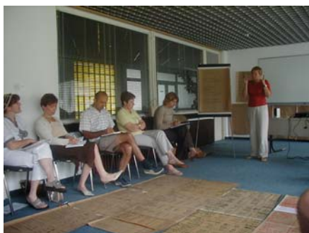
STUBIČKE TOPLICE, srpanj 2003.